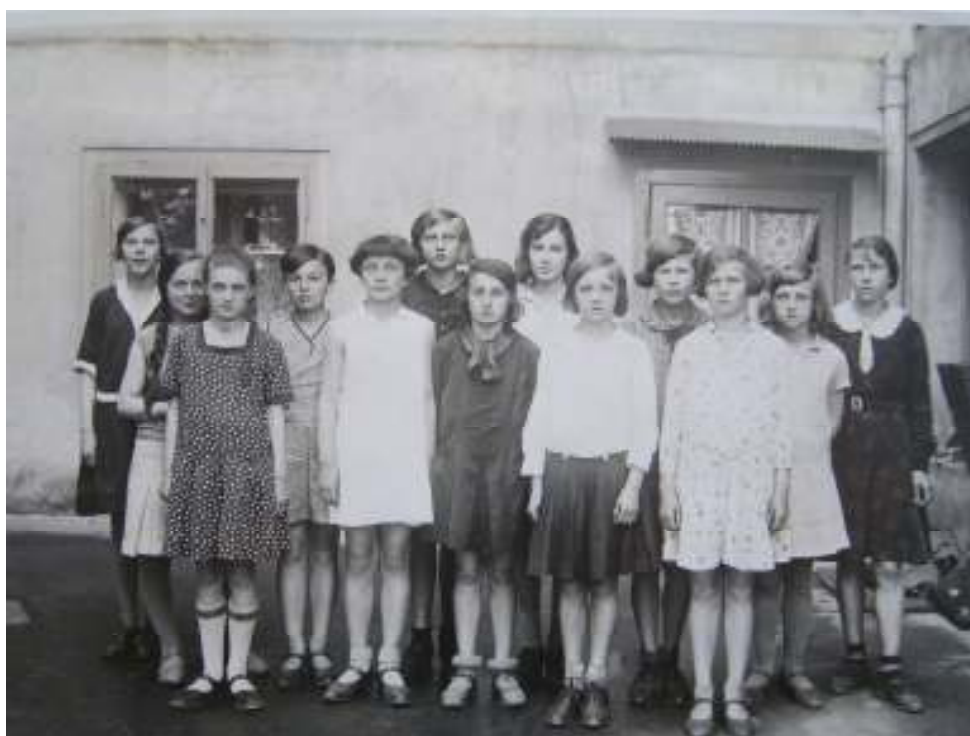
Žákyně měšťanské školy dívčí Mělník – školní rok 1930/1931