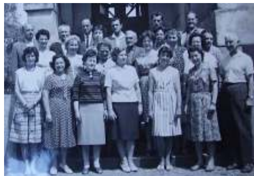
Učitelský sbor 1964/1965